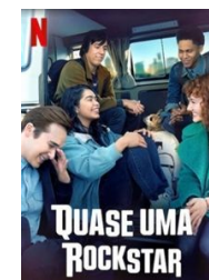
Quase uma Rockstar

Um filme para a família toda assistir e se emocionar. Recém-lançado pelo Netflix, Quase uma Rockstar é inspirado no livro de Matthew Quick e apresenta um enredo que faz chorar, torcer e sofrer junto com a protagonista. Um trama tocante de uma adolescente que perde o pai e passa a viver uma vida complicada ao lado da mãe, mas sem perder a alegria e esperança.